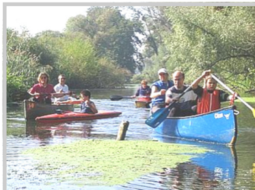
KGN - Wandersport