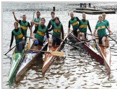
KGN - Rennsport