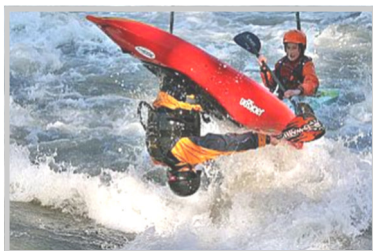
KGN - Wildwassersport