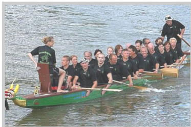
KGN - Drachenbootsport