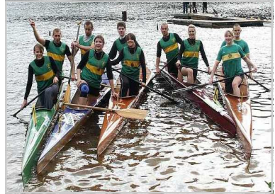
KGN - Rennsport