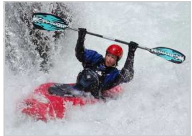
KGN - Wildwassersport