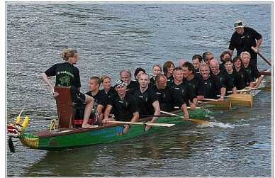
KGN - Drachenbootsport