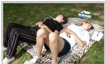
Erschöpfung nach den Rennen