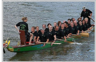
KGN - Drachenbootsport