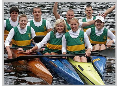
KGN - Rennsport