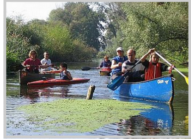
KGN - Wandersport