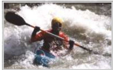
KGN - Wildwassersport