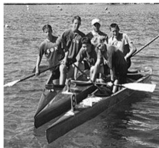
KGN - Rennsport