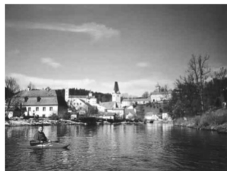
KGN - Wandersport