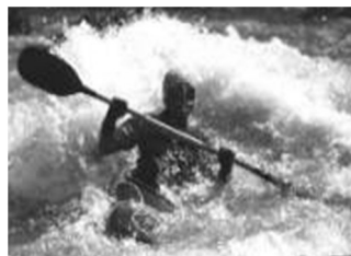
KGN - Wildwassersport